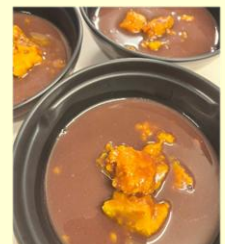
ホッと温まるおしろこ