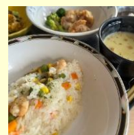
クリスマスメニューピラフ