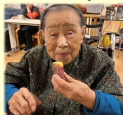
暖炉で焼いた焼き芋