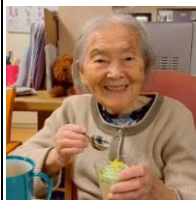
クリスマスツリーのプリンをいただきました♪

十二月二十四日にクリスマス会が行われました。今年もユニットごとに分かれての開催です。みんなフロアに集まってサンタクロースの登場を待っていたところ、軽快なリズムに合わせてフロアには、なんとアフロヘアに髭をつけた職員たち！昭和生まれならお馴染みの髭ダンスを披露してくれました。みかんやリンゴを、アフロヘアの職員が持った棒の先につけたフォークに投げてましたが、ほとんど刺さらず…。利用者様にも投げて頂きましたが、これも刺さらず…。ですが、大爆笑のなか幕を閉じました。