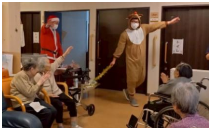
サンタとトナカイがプレゼントとともに登場！

十二月二十四日にクリスマス会が行われました。今年もユニットごとに分かれての開催です。みんなフロアに集まってサンタクロースの登場を待っていたところ、軽快なリズムに合わせてフロアには、なんとアフロヘアに髭をつけた職員たち！昭和生まれならお馴染みの髭ダンスを披露してくれました。みかんやリンゴを、アフロヘアの職員が持った棒の先につけたフォークに投げてましたが、ほとんど刺さらず…。利用者様にも投げて頂きましたが、これも刺さらず…。ですが、大爆笑のなか幕を閉じました。