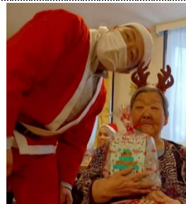
サンタからは温かいプレゼントをもらいました♪

余興が終わると聞こえてきたのは、シャンシャンシャンと、鈴の音。ここでお待ちかねのサンタさんの登場です！サンタクロースがそりに乗せたプレゼントを利用者様それぞれに手渡し、笑顔の利用者様と一緒に記念写真を撮影しました。その日は昼食もおやつもクリスマス仕様です。おやつは、利用者様たちに飾りつけをお手伝いいただいた、クリスマスツリーを模した可愛くて美味しいプリンです。「いくつ食べてもいいな。」という声も聞こえます。来年もみんなで楽しいクリスマス会を過ごしましょう！サンタさん、また来てね！