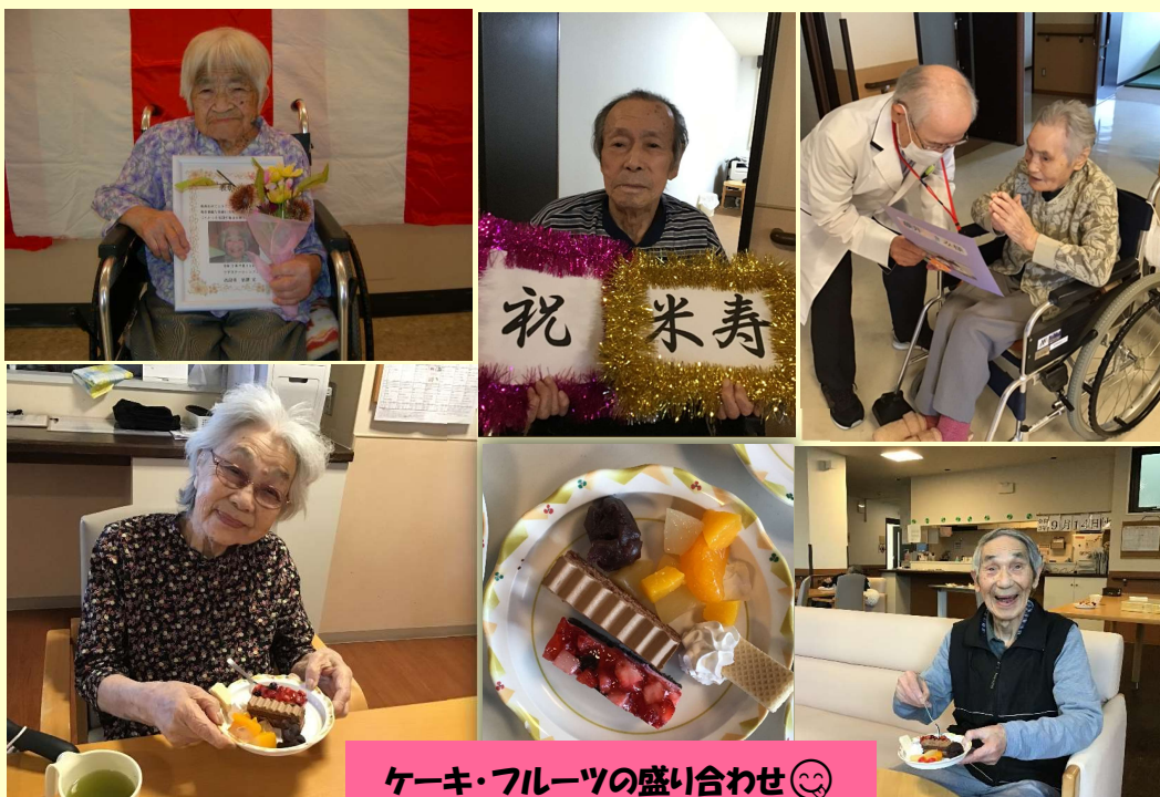
ケーキ・フルーツの盛り合わせ😊